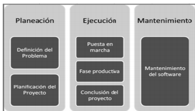
Figura 1. Fases Principales de un Proyecto

Según la metodología PMBOK [4] “Las fases del proyecto son divisiones dentro del mismo proyecto, donde es necesario ejercer un control adicional para gestionar eficazmente la conclusión de un entregable mayor”. Las fases de un proyecto se pueden relacionar de diferentes maneras una de forma secuencial donde el inicio de una depende de la culminación de la anterior, de una manera superpuesta, donde la fase siguiente comienza antes de que culmine la anterior y la tercera corresponde con una relación iterativa donde en un momento dado solo se planifica una fase y la siguiente depende del avance de proyecto y la generación de los entregables en la etapa actual. En la Figura 1, se muestra la estructura básica de un proyecto donde se agrupan diferentes componentes en cada fase.